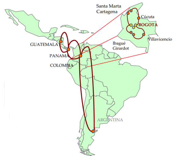
Fig 1. Mapa de redes sociales de Latinoamérica y Colombia [18].

En Latinoamérica se pueden destacar varios países como focos de redes de apoyo social a las personas enfermas, tanto adultos mayores, como enfermos crónicos o pasantes, como son Argentina, Panamá, Guatemala y Colombia. Y en este último se pueden destacar las ciudades de Santa Martha, Cartagena, Barranquilla, Cúcuta, Ibagué, Girardot y Villavicencio [18].