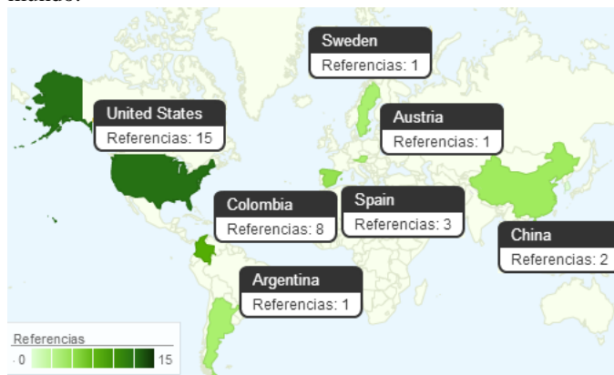
Fig 4. Mapa mundial de soporte social basado TIC, según el número de referencias estudiadas.

Posterior a los análisis anteriores se realizó una distribución geográfica acerca de la concentración de cada uno de estos materiales investigativos, y de esta forma poder identificar el nivel de aprehensión del soporte social basado en TIC en el mundo.