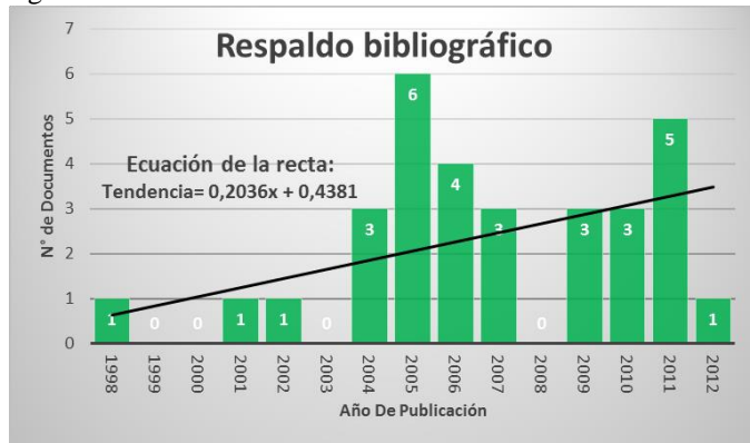
Fig 3. Número de Respaldos bibliográficos según el año de publicación.

Para efectos de este estudio, se tomó como parámetro cronológico una escala anual, comprendida en un intervalo de tiempo de 3 lustros, lo cual nos ayuda a determinar el desarrollo más reciente de estas tecnologías. Para ello se identificaron las fechas de publicación de cada documento, y de esta manera generar un análisis cualitativo, el cual se ve reflejado en la figura 3.